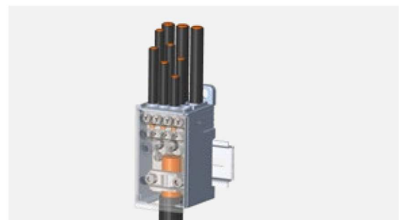
vergleichbare Anwendung mit PVB 250-3/8 comparable application with PVB 250-3/8 connexion comparable avec PVB 250-3/8