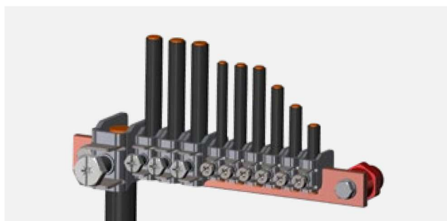
Anwendung mit Sammelschienenklemmen application with CU-bar terminals connexion avec bornes pour jeu de barres CU