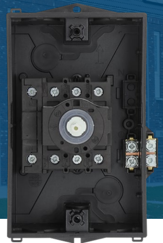
Binnenzijde PV-werkschakelaar 4-polig, 25A