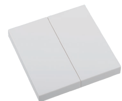
2x EIN/AUS | 4x IMPULS RTS23-ACC-01-xxP2