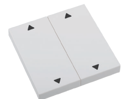
2x AUF/ZU RTS23-ACC-02-xxP2