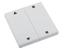
1x AUF/STOPP/ZU RTS23-ACC-03-xxP2