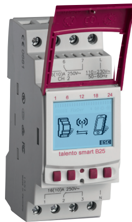
talento smart B25