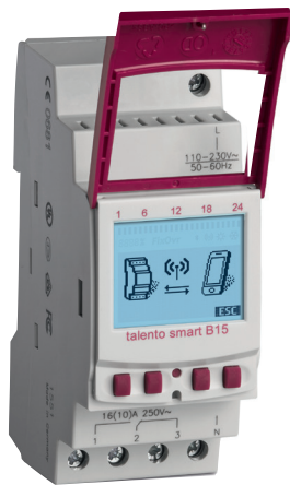
talento smart B15

Digitale Zeitschaltuhren, DIN-Schiene, Wochenprogramm